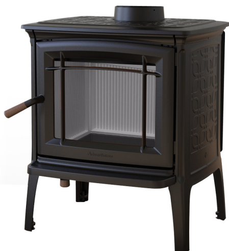
NEGRO MATE MATTE BLACK