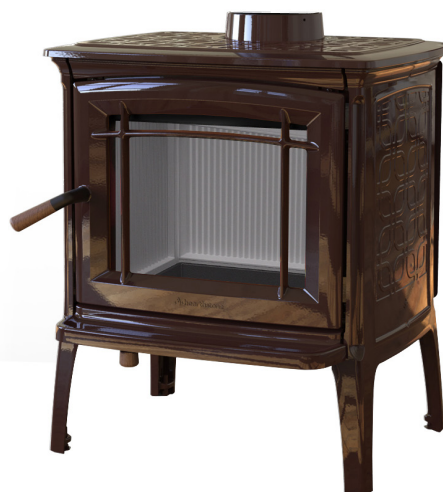
ESMALTE MARRÓN MAYÓLICA MAJOLICA BROWN ENAMEL

*Acabado interior en HF tratado con fundente blanco para resaltar el efecto de las llamas y ofrecer mayor luminosidad.